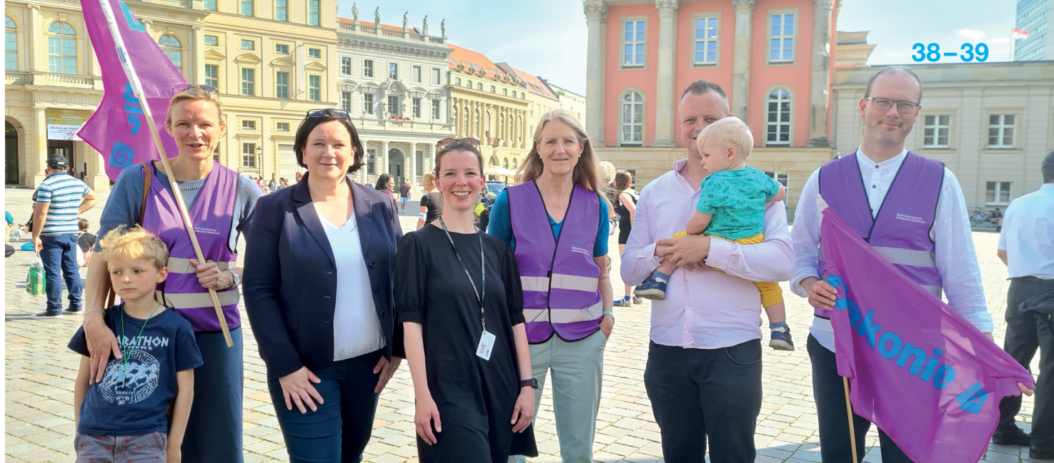
Das DWBO im Verbund der LIGA und der Landeskitaelternbeirat Brandenburg organisieren eine Demonstration vor dem Brandenburger Landtag. Gemeinsam mit Kitamitarbeitenden, Trägervertreter:innen und Eltern fordern sie Ministerin Britta Ernst und die Abgeordneten auf, die begonnene Kitarechtsreform fortzuführen.