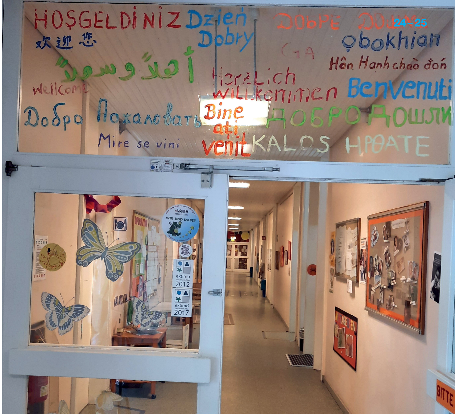
Eingang Kita Stubs und Fridolin